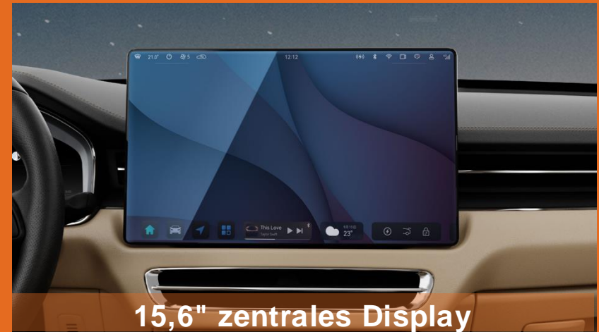
15,6" zentrales Display